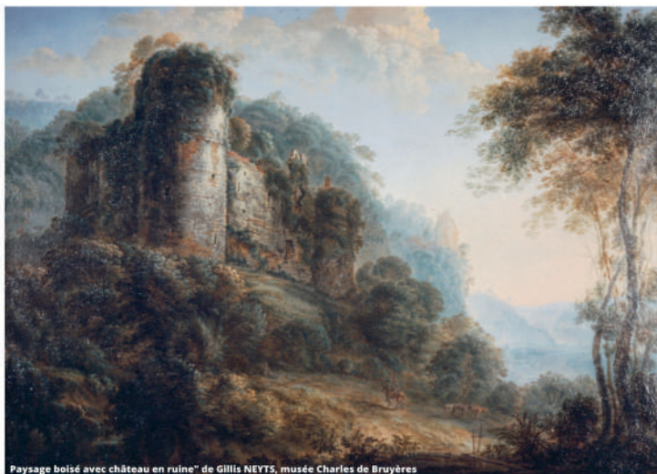
Paysage boisé avec château en ruine" de Gillis NEYTS, musée Charles de Bruyères

Notre tableau retrouvera sa place au musée Charles de Bruyères au début du mois de juillet.